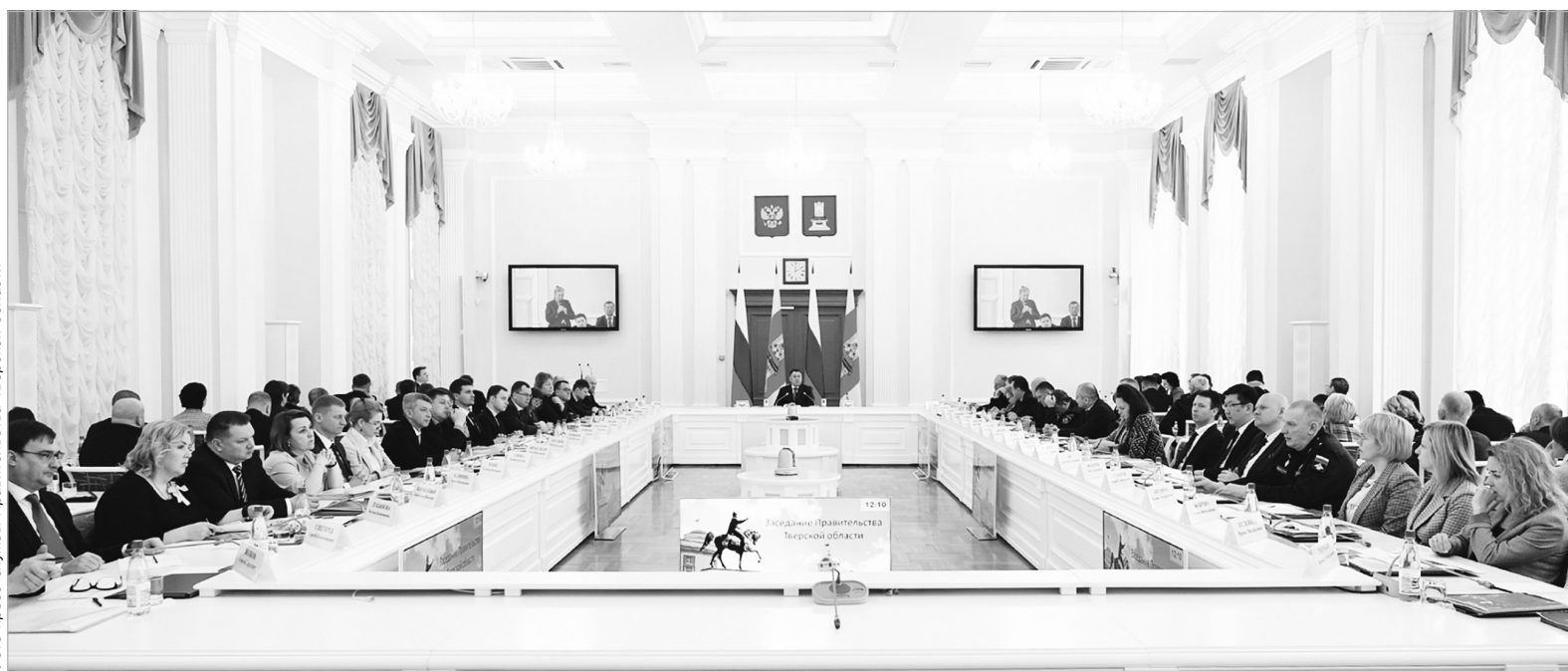
На заседании Правительства Тверской области подведены итоги проведения конкурентных закупок в 2022 году

Кроме того, местные поставщики участвовали в за-