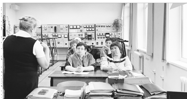
Более 900 жителей Верхневолжья получили новую профессию в рамках нацпроекта «Демография» в 2022 году

Чтобы пройти бесплатное переобучение в 2023 году в рамках федерального проекта «Содействие занятости» нацпроекта «Демография», необходимо подать заявление на портале «Работа в России» по ссылке: https://trudvsem.ru/ , в разделе «Пройти обучение в рамках федерального проекта «Содействие занятости»».