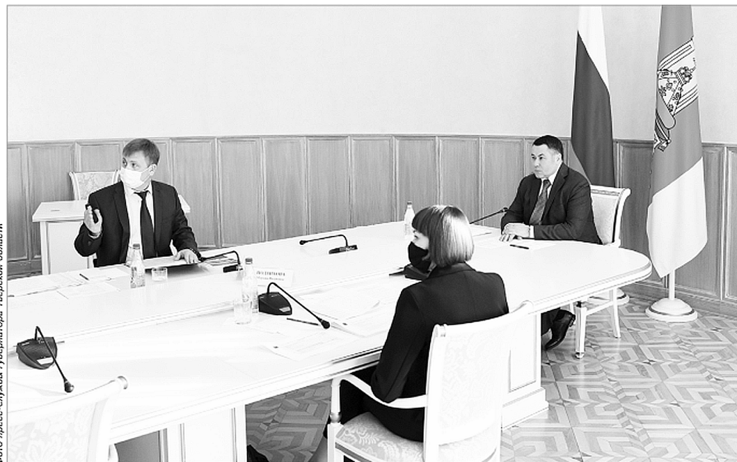
Дополнительные объекты включают в областную программу работ на автодорогах регионального и межмуниципального значения в 2020-2022 годах. Вопрос рассмотрен на совещании, которое 18 мая провел губернатор Игорь Руденя.

На совещании рассмотрены дополнительные объекты для включения в программу. Среди наиболее значимых – мост через реку Большая Лоча в Ржеве, подъездные пути к крупным ком-