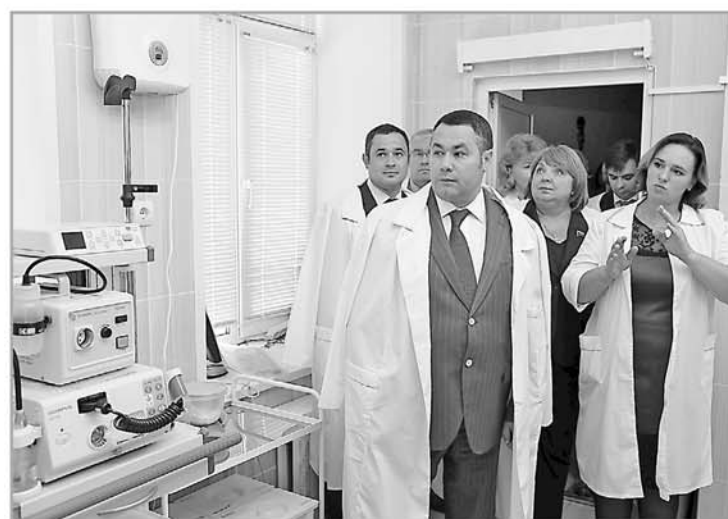
Высокотехнологичная медицинская помощь станет доступнее для жителей Тверской области

Еще одна приятная новость – в Тверскую область в авгу-