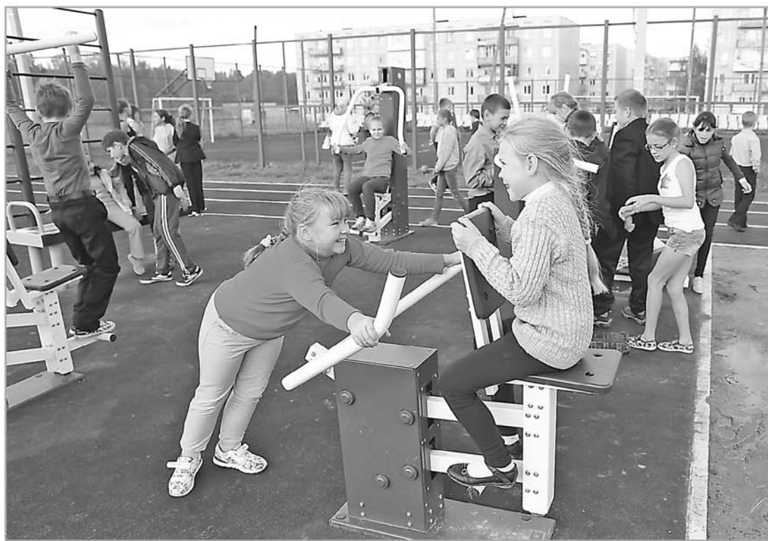
Жители городских и сельских поселений нередко выбирают в качестве приоритетных проектов строительство спортивных и детских игровых площадок, обустройство зон отдыха

Но можно не просто заявлять о проблеме, а решать ее вместе с руководством региона, став членом одной большой команды. По такому принципу действует программа поддержки местных инициатив. Ее суть в том, что жители городских и сельских поселений при значительной финансовой поддержке области сами реализуют наиболее важный для них проект. Это может быть ремонт местной дороги или водопровода, установка уличных тренажеров или, например, обустройство пожарного пруда.