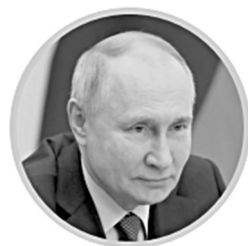
ВЛАДИМИР ПУТИН Президент России

Посетители выставки могут познакомиться с самыми современными достижениями России в науке, медицине, промышленности, сельском хозяйстве, строительстве, цифровизации, спорте и искусстве. Ждет гостей и стенд, на котором свои успехи представила Тверская область.