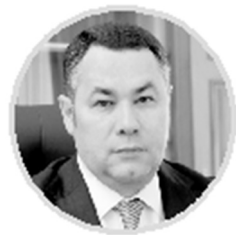
ИГОРЬ РУДЕНЯ Губернатор Тверской области

С помощью мобильного приложения «Россия ВДНХ» можно проголосовать за понравившуюся экспозицию. Для этого нужно навести смартфон на QR-код, который есть на каждом стенде. Впрочем, поддержать Тверскую область можно и без личного присутствия - голосование доступно и в виртуальном туре по экспозициям на официальном сайте выставки russia.gu .