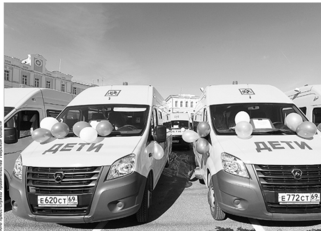
На площади у здания Правительства Тверской области рядами выстроились новые школьные автобусы «ГАЗель Next», предназначенные для перевозки детей от 6 до 16 лет

С 2017 года из консолидированного бюджета Тверской области на капитальный ремонт и укрепление материально-технической базы школ и детских садов было направлено свыше 3,8 млрд рублей. Об этом заявил губернатор Тверской области Игорь Руденя 25 августа на заседании регионального Правительства, посвященном подготовке к новому учебному году.