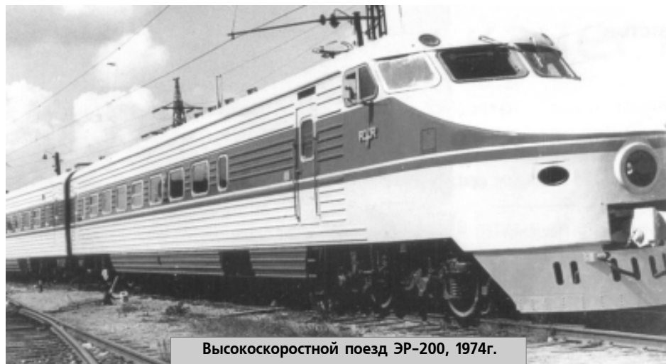
Высокоскоростной поезд ЭР-200, 1974г.