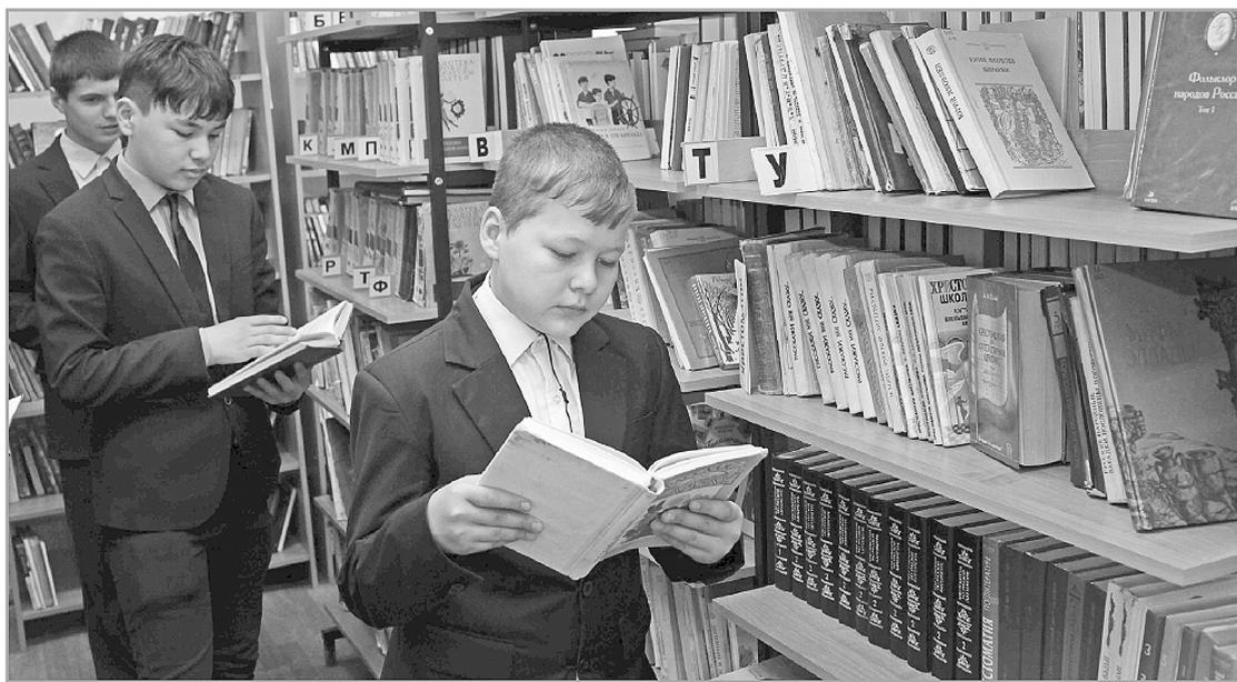
Многие школы области получают дополнительную поддержку благодаря тому, что новая власть более эффективно считает и использует каждый бюджетный рубль

Игорь Руденя во время поездки по области часто посещает районные школы, другие образовательные учреждения и всегда интересуется, как организован учебный процесс, по каким дорогам везут детей школьные автобусы, комфортно ли ребятам учиться, как и где они сдадут ЕГЭ. Этот интерес не праздный. Как известно, именно глава региона теперь возглавляет областную бюджетную комиссию. Игорь Руденя принял такое решение, чтобы, с одной стороны, навести порядок в расходах казны, а с другой – похозяйски сократить бюрократию и ускорить распределение бюджетных средств на те направления, где областные финансы особенно необходимы. И вот благодаря новому подходу, за счет экономии и поступления федеральных трансфертов появилась возможность направить дополнительное финансирование в социальную сферу.