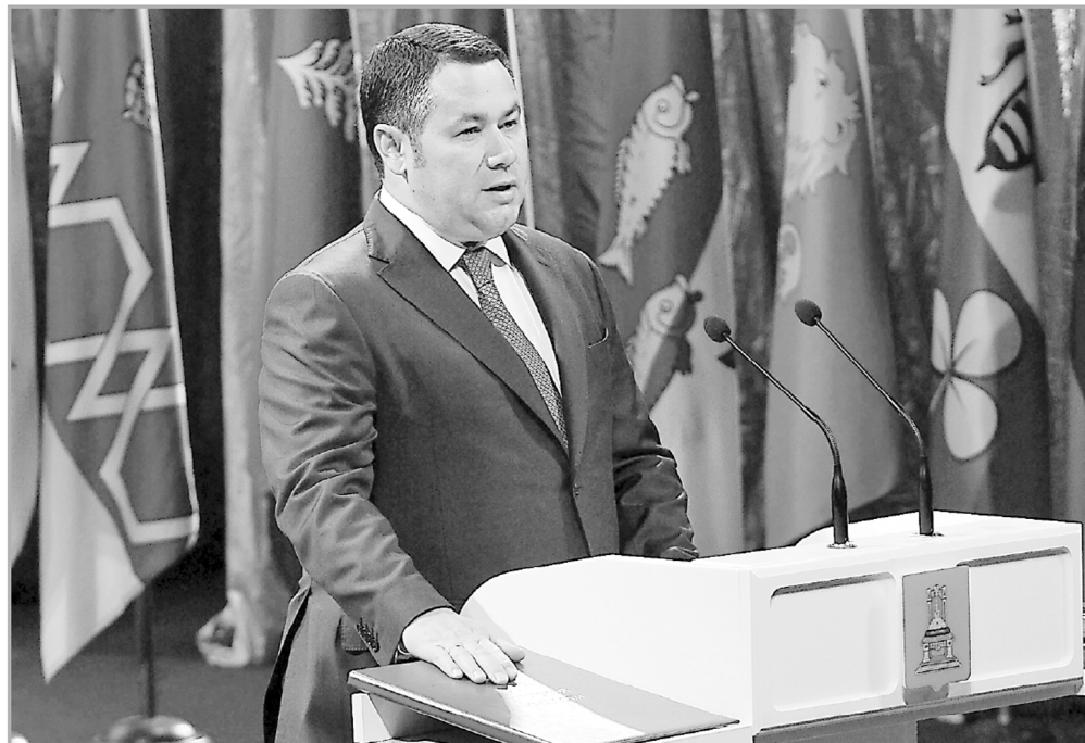
23 сентября Игорь Руденя принес присягу и, в соответствии со статьей 111 Устава Тверской области, вступил в должность губернатора региона

Игорь Руденя принес присягу на верность интересам Верхневолжья