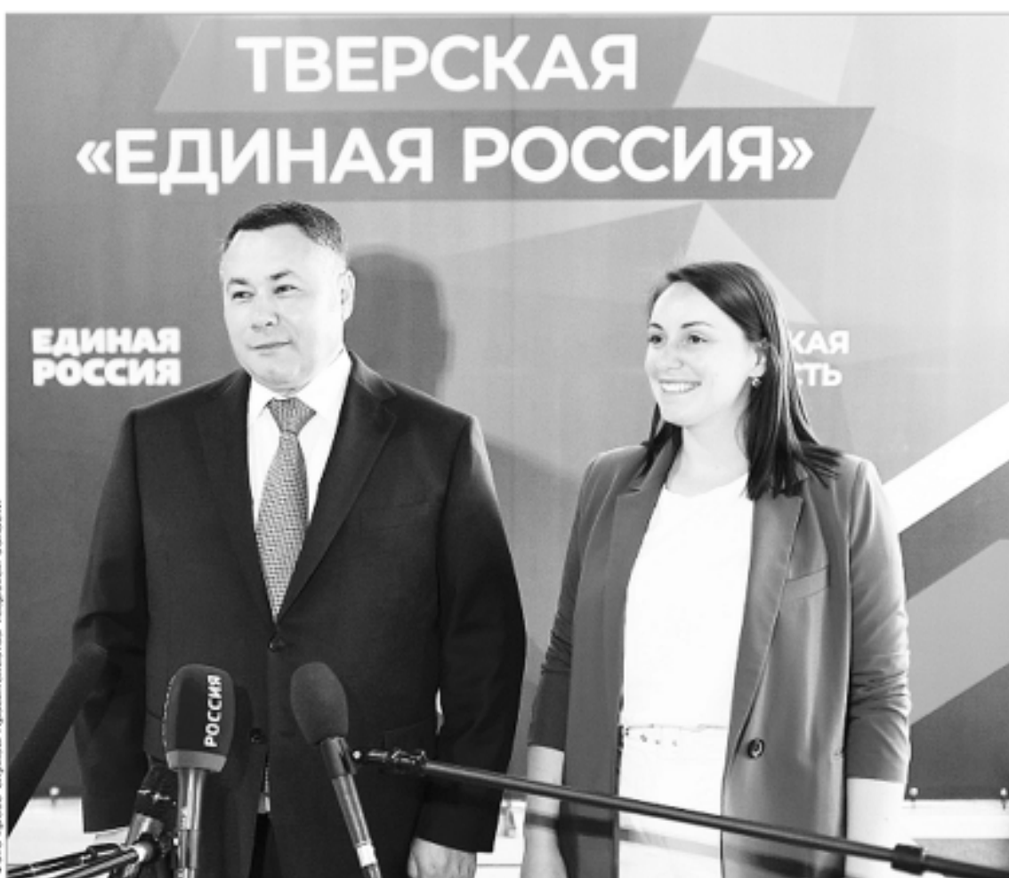
Губернатор Игорь Руденя и директор Тверского добровольческого центра «МыВместе» Юлия Саранова

– То, что губернатор Игорь Руденя возглавил региональный список «Единой России» на предстоящих выборах, определяет дальнейшее развитие региона. Газификация, модернизация инфраструктуры, транспортной доступности – это основа для роста экономики региона, открытия новых производств, рабочих мест и сокращения миграционного оттока. Задачи сложные, ответственные. Результат этой работы люди должны ощутить на себе – и в позитивном ключе.