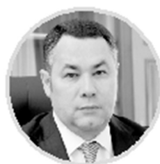
ИГОРЬ РУДНЯ Губернатор Тверской области

В Верхневолжье последовательно реализуются поставленные Президентом России Владимиром Путиным задачи по формированию суверенной национальной экономики, поддержке предприятий и компаний, которые обеспечивают освоение новых технологий, создание современных индустриальных мощностей и новых рабочих мест.