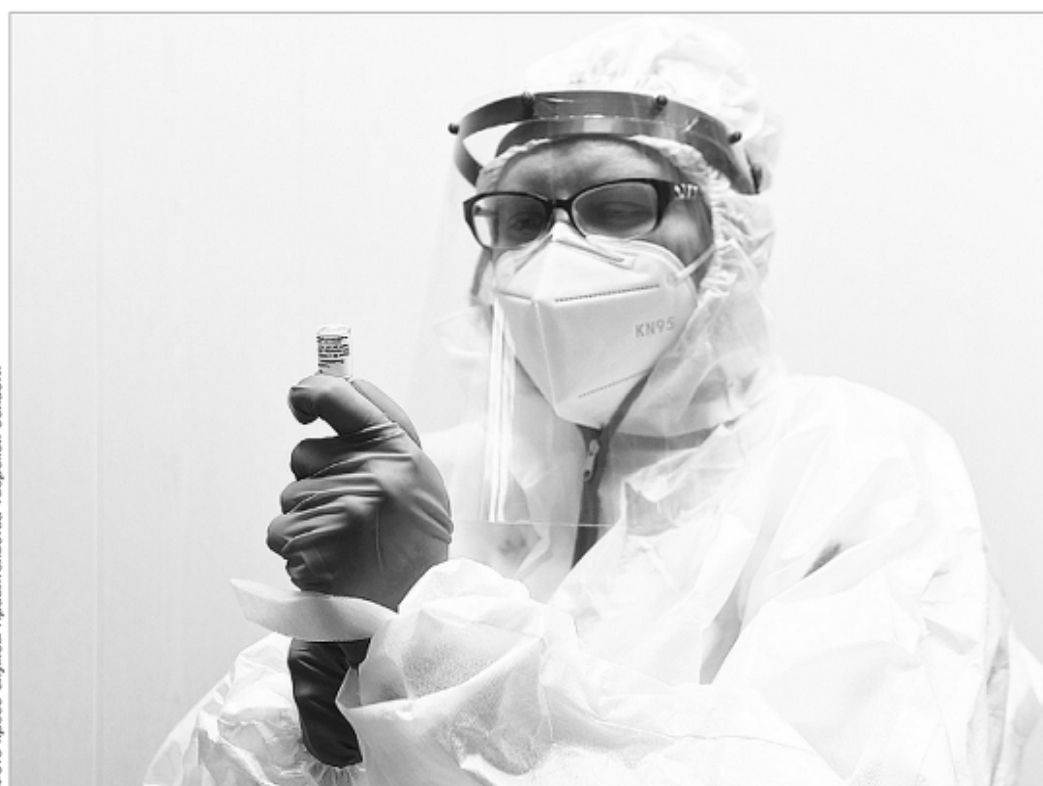
По данным Минздрава, массовая вакцинация от коронавируса ведется препаратом «Спутник V», затем добавится «ЭпиВакКорона» и «КовиВак»

Всех жителей Тверской области, записавшихся на вакцина-