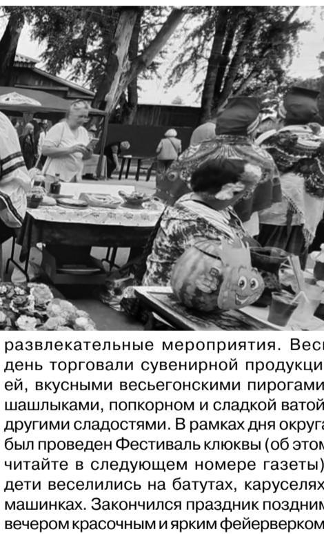
На снимках: моменты праздника

Праздничная программа продолжалась весь день: концерты, мастер-классы на разных площадках, пенная вечеринка, спортивные товарищеские встречи по футболу, шахматные баталии и другие