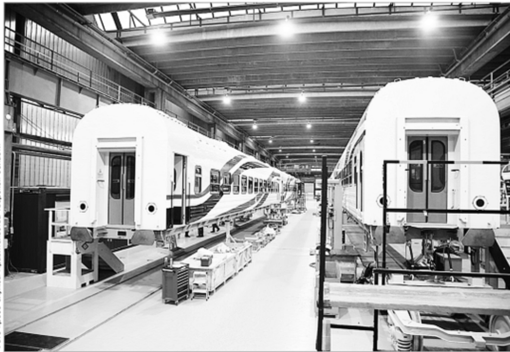
Вагоны модели 61-4514 производства ТВЗ, которые поставляются в Египет, оснащены принудительной вентиляцией и рассчитаны на 88 посадочных мест

Тверской вагоностроительный завод специализируется на выпуске одно- и двухэтажных пассажирских вагонов, вагонов для международных пассажирских перевозок, электропоездов, различных типов вагонов спецназначения, кузовов вагонов метро и трамваев. В первые дни февраля в цехе сварки металлоконструкций Тверского вагоностроительного завода состоялась презентация роботизированной измерительной ячейки по определению дефектов сварных соединений,