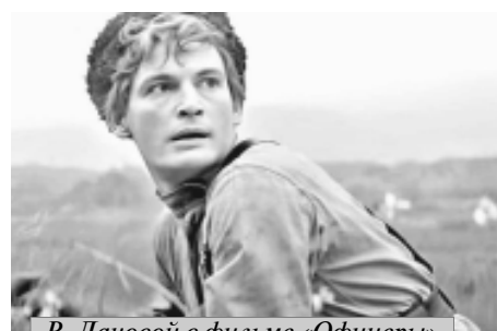
В. Лановой в фильме «Офицеры»