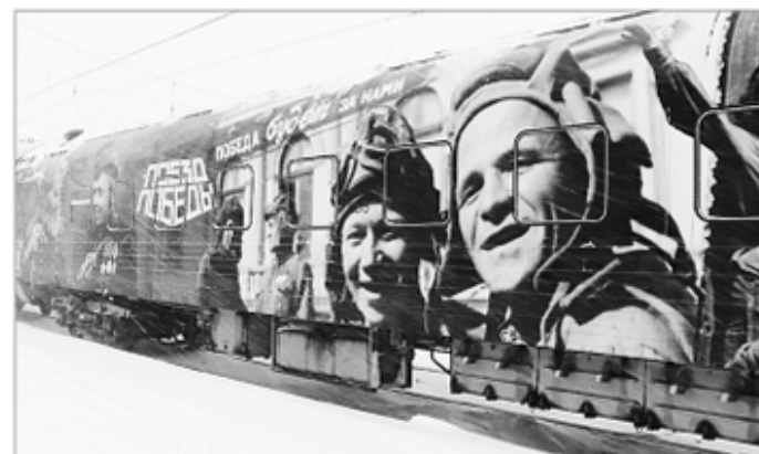
С 23 по 25 февраля в городе воинской славы Ржеве будет работать передвижной музей «Поезд Победы»

На сегодняшний день ни в одном музее мира нет такого количества многофигурных композиций в скульптуре, как в «Поезде Победы». Помимо экспозиции, выставка имеет 50 видеопрокторов, 18 видеостен, 12 тач-столов, которые благодаря световым и звуковым эффектам воссоздают воздушные бои и массированные танковые атаки, рисуют картины походной солдатской жизни и тихие воспоминания мирного довоенного времени. Всё это делает экспозицию более проникновенной, а ощущения от увиденного – более острыми. Подробнее о «Поезде Победы» можно почитать на сайте https://поезд-победы.рф