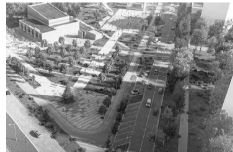
Парковая зона по ул. Венецианова в Удомле

«Комфортная городская среда – лицо муниципальных образований, Тверской области. От того, насколько современными, удобными и комфортными будут наши города и поселки, зависит привлекательность региона для молодежи, развитие экономики и туризма, улучшение демографической ситуации», – уверен Игорь Руденя.