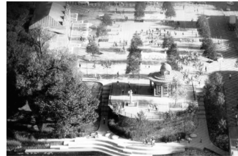
Проект площади 9 Января в Торжке

Всероссийский конкурс лучших проектов создания комфортной городской среды в малых городах и исторических поселениях был организован в 2018 году по поручению Президента Российской Федерации Владимира Путина.