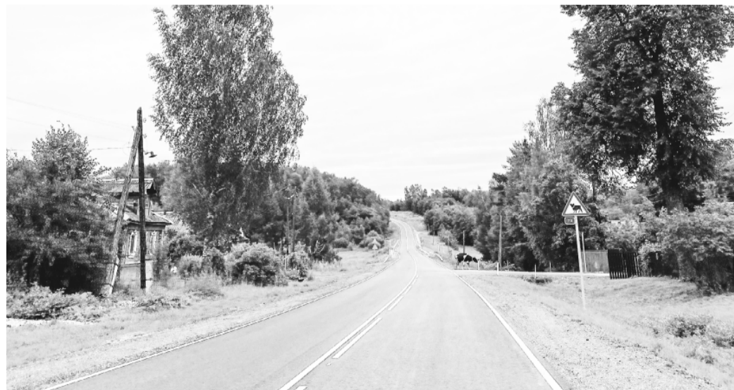
В Тверской области, по поручению губернатора Игоря Рудени, на год раньше предусмотренного срока отремонтируют дорогу от М-10, проходящую по Калининскому и Старицкому округам

Трасса является туристическим маршрутом в город Старица, к древним храмам и комплексу Свято-Успенского монастыря. Дорога проходит параллельно федеральной трассе Р-132 «Золотое кольцо» на участке от М-10 до Старицы.