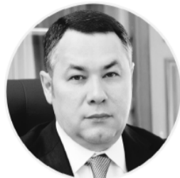
ИГОРЬ РУДЕНЯ Губернатор Тверской области

2022 год стал новым этапом в процессе газификации Тверской области. Впервые за последние годы газ пришел сразу в три ранее негазифицированных муниципалитета – Жарковский, Краснохолмский и Молоковский округа. До 2026 года планируется газификация всех ранее негазифицированных муниципалитетов северо-востока и юго-запада Тверской области.