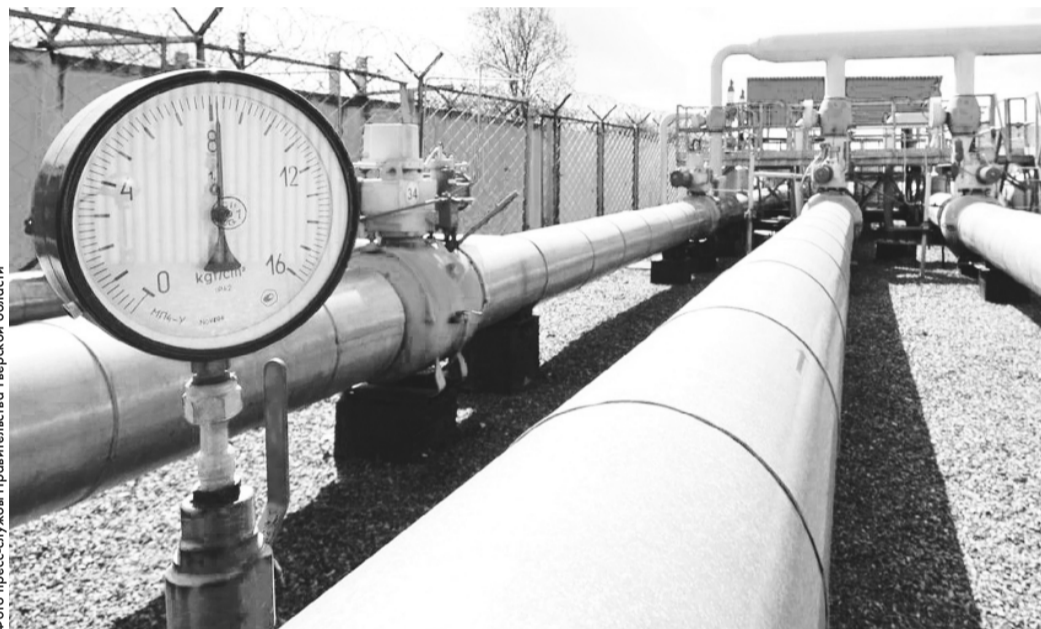
В Тверской области завершено строительство двух газопроводов в Сонковском и Лихославльском округах

2022 год стал новым этапом в процессе газификации Тверской области. Впервые за последние годы газ пришел сразу в три ранее негазифицированных муниципалитета – Жарковский, Краснохолмский и Молоковский округа. До 2026 года планируется газификация всех ранее негазифицированных муниципалитетов северо-востока и юго-запада Тверской области.