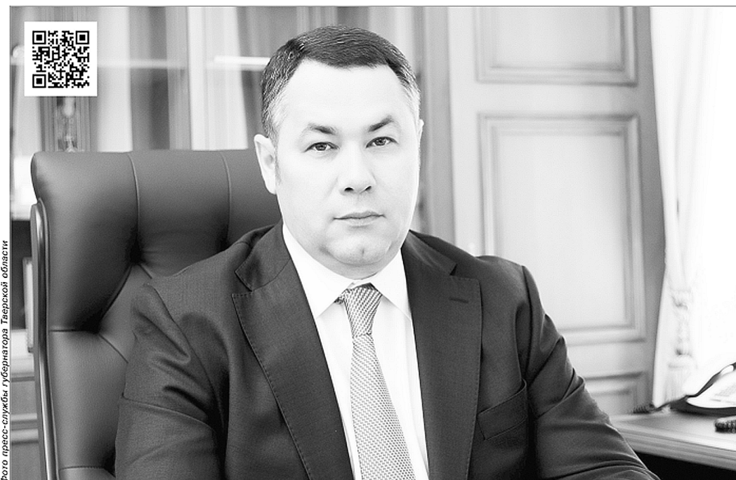
30 марта губернатор Тверской области обратился к жителям и гостям Тверской области в связи со сложившейся эпидемиологической ситуацией. По ссылке в QR коде – видео данного обращения.