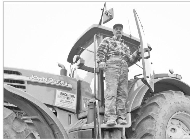
Тверскую область ставят в пример регионам Нечерноземья

Идеология госпрограммы обсуждалась именно на тверской земле, где Владимир Путин провел большое совещание, посвященное сельскому хозяйству. «Наша цель применительно к данной встрече – наметить эффективные меры по развитию именно этого региона, но как части всего сельскохозяйственного комплекса Российской Федерации», – поставил задачу глава государства. Президент подчеркнул, что при